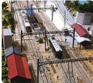
ジオラマコーナー(イメージ)