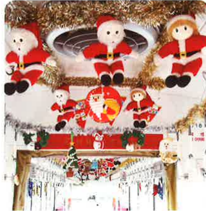
クリスマストrein(イメージ) [通年11月下旬~12/25頃まで運行]