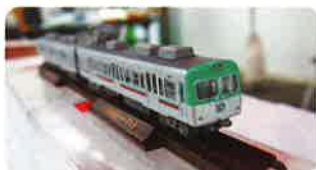
鉄道コレクション 「上毛電気鉄道711-721」(イメージ)