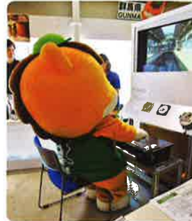
電車運転 シミュレーション体験(イメージ)