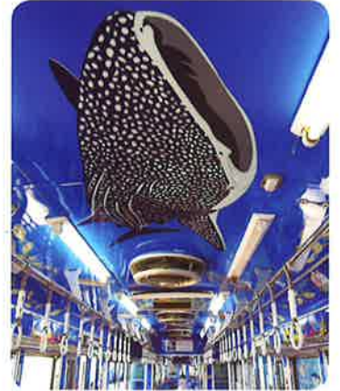
水族館電車(イメージ) [通年運行]