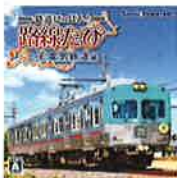
「鉄道につぼん! 路線たび 上毛電気鉄道編」(イメージ)