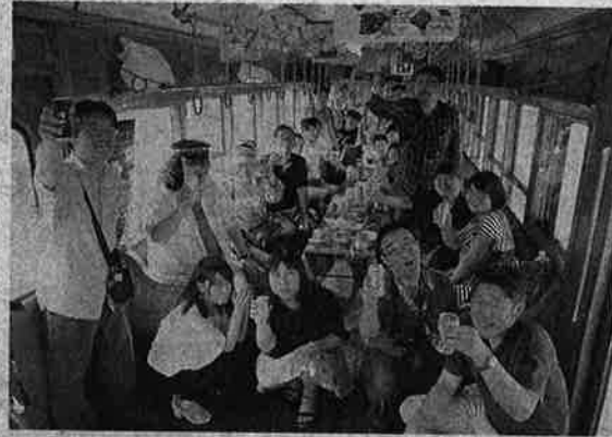
「乾杯」を楽しむ上毛電気鉄道のビール列車(西桐生駅で)

昭和初期に製造された電車「デハ101」を、上毛電鉄で運行させ、集まった上電ファンが赤城山麓の夏景色を堪能した。ビール列車は、上電